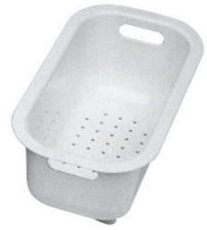
escurre pasta blanco 8151 100